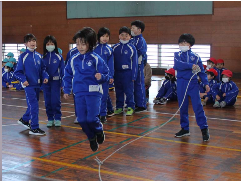
12 / 19 (火) なわとび集会