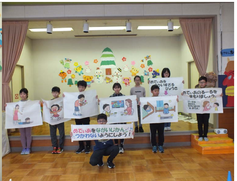
1 / 15 (月) 保健委員会 メディアコントロールよびかけ (沼館保育所)