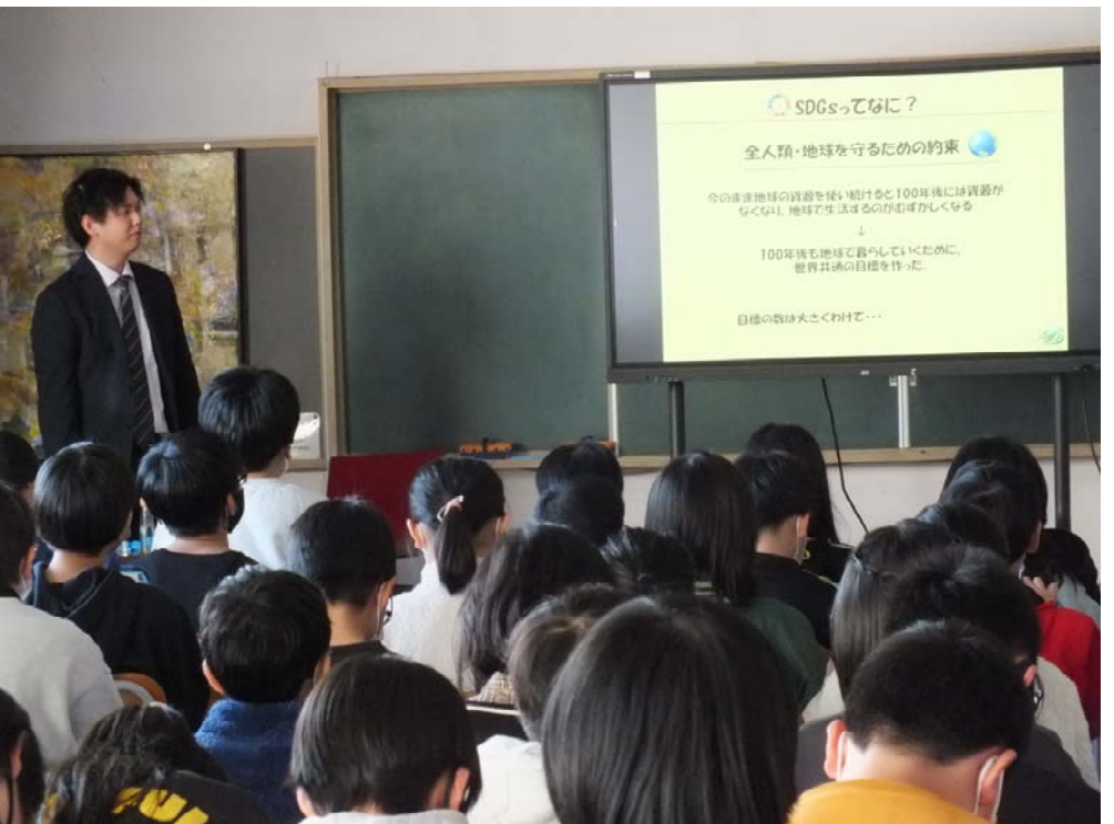
12 / 21 (木) SDGs 学習会 (5年生と6年生が参加)