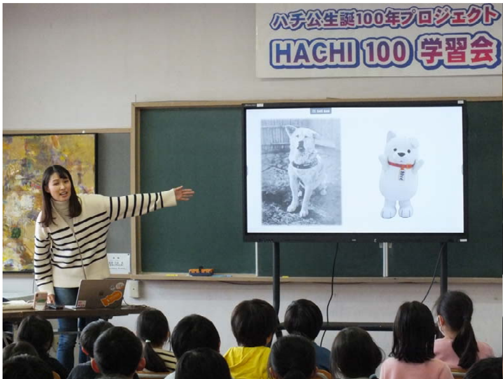
12 / 19 (火) HACHI 100 学習会 (3年生と4年生が参加)